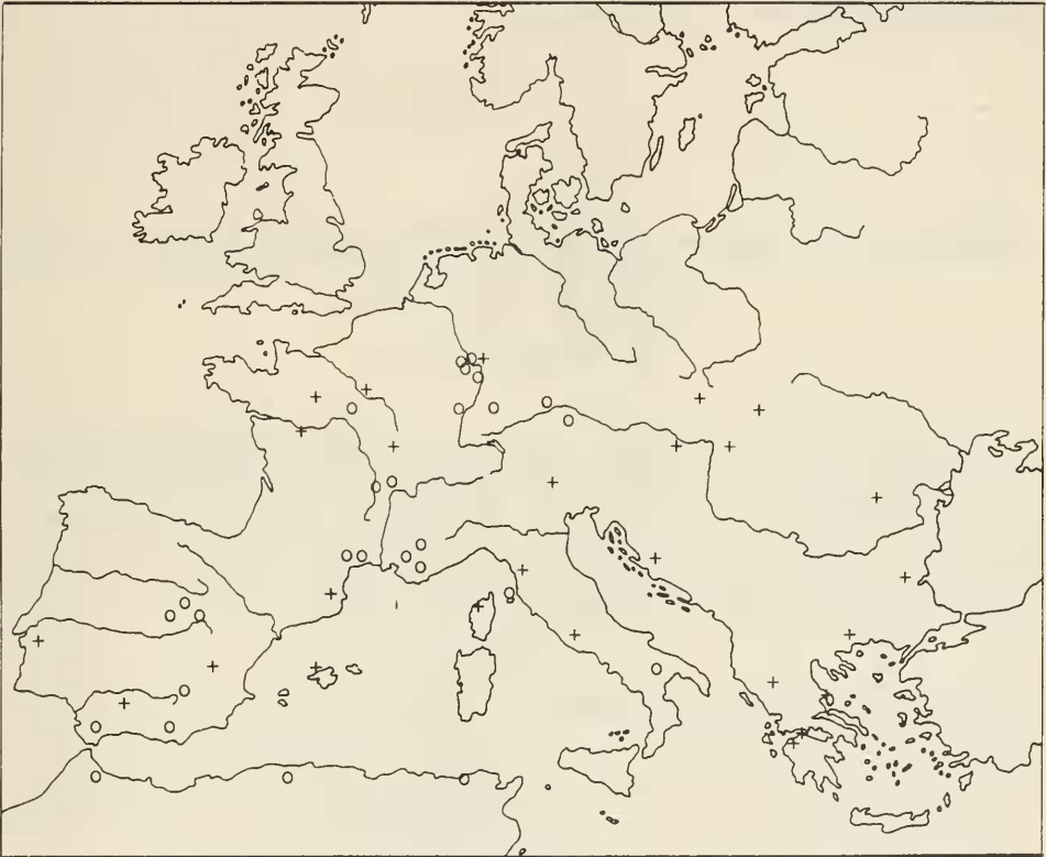
Abb 2. Verbreitung von Anthaxia mendizabali COBOS (o) und Anthaxia funerula (ILLIG.) (+) in Europa.

Einen Überblick über die Verbreitung der beiden Arten A. funerula (ILLIG.) und A. mendizabali COBOS in Europa zeigt Abb. 2. Als besonders erwähnenswert muß ein Fund aus Deutschland hervorgehoben werden: Ein Männchen von A. funerula , 5. 7. 1919, Lorsbach, Taunus, aus der Sammlung BÜCKING, das dem Verfasser dankenswerterweise von G. SCHMIDT, Polling, zur Überprüfung und zum Verbleib überlassen wurde. Dieser Fund stellt wohl den bis dato einzigen Nachweis von A. funerula auf deutschem Gebiet dar; er wird auch bei HORION l. c. zitiert. Bemerkenswert ist, daß die nächstliegenden Biotope des Rheingebiets allesamt A. mendizabali aufweisen.